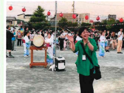
▲地域の皆様と楽しく盆踊り 今年は多くの地域で開催されました