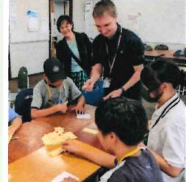
▲Chukyo English Village 楽しく英語ゲーム