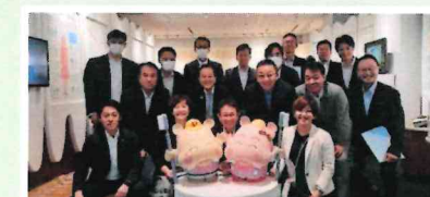
▲健康と食議連 愛知県歯科医師会館で研修