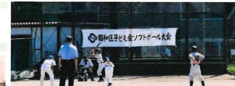
▲熱戦が続いた子どもソフトボール大会