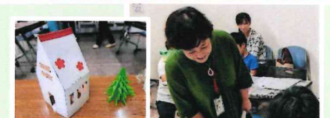
▲夏休み子ども工作教室 夢中になって、素敵な作品を完成させました