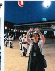
盆踊りを楽しませていただきました。