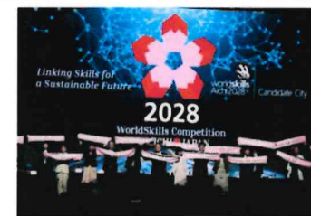
2024年9月9日 WSI 総会(ワフ・リヨ)での日本招致チームによる最終アピールの様子

愛知県大会では、人への投資の重要性を国内外にアピールするなどの目的をもって、開催計画を策定していく予定です。また、一校一団サポート事業として、各国選手団の小中学校等訪問や、訪問先の子供たちが大会見学で当該国の選手を応援するなどの交流事業を実施していく予定です。