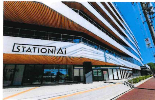
エントランス外観 コンビニもあります