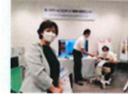
介護連で国立長寿医療研究センター内「あいちサービシロ봇実用化支援センター」を視察。