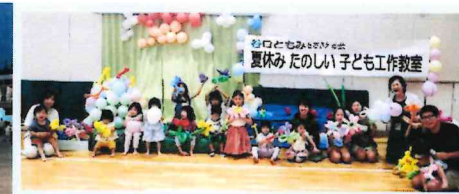
学区の運動会では幅広い年代の方が楽しめる競技が工夫されています。